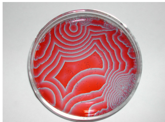
Abb. 2 4 , Belousov-Zhabotinsky-Reaktion

Prigogine untersuchte insbesondere auch zyklische Reaktionen, darunter die Belousov-Zhabotinsky-Reaktion. Diese Reaktion bildet immer wieder komplexe Muster, die im Detail jedes Mal anders aussehen (Abb. 2).