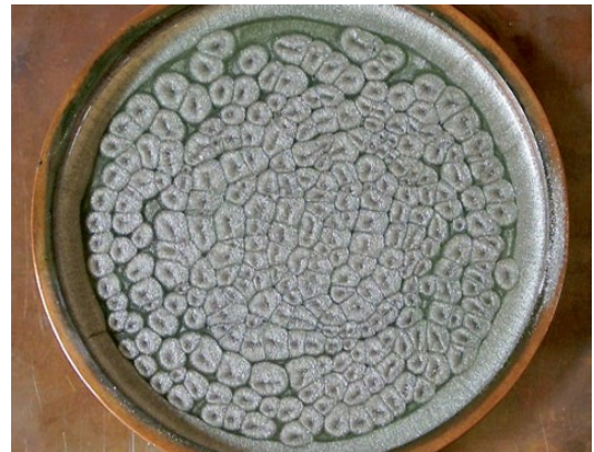
Abb. 1 3 , Bénard-Zellen

Besonders anschaulich wird dies bei der Betrachtung von Bénard-Zellen (Abb. 1). Diese bilden sich, sobald man eine mit Öl gefüllte Glasschale (zur besseren Sichtbarkeit enthält sie feine Metallspäne) von unten erhitzt und die Wärmezufuhr langsam erhöht. Wird eine charakteristische Wärmezufuhr überschritten, bilden sich plötzlich 5- und 6-eckige Zellen, weil das Öl die überkritische Wärme nicht anders abführen ( dissipieren ) kann: Die Zellen wälzen sich synchron ab, wodurch die überschüssige Wärme effektiv abgeführt wird.